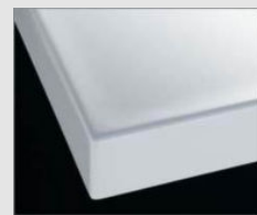
H プレネオホワイト